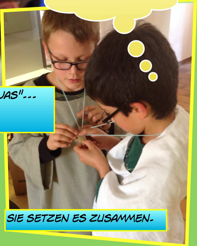
SIE SETZEN ES ZUSAMMEN.